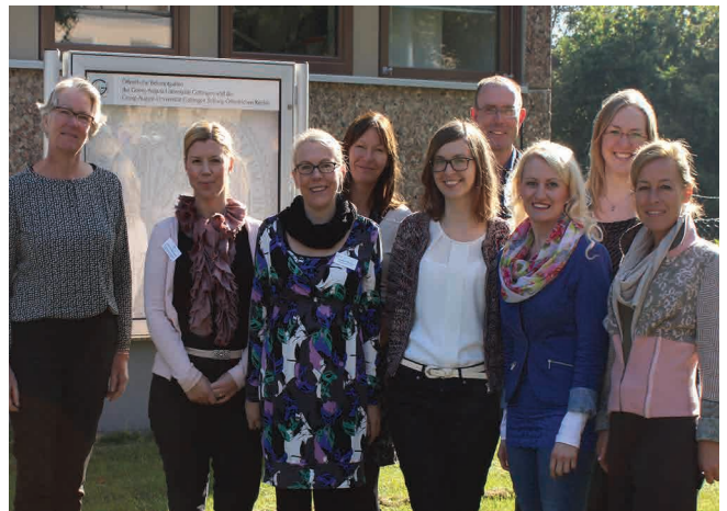
Teilnehmer der U4 Staff Training Week "Welcome Centre". Göttingen, 10/2013

Die Ausschreibungsfrist für Mobilitäten in 2014 endet am 15. November 2013. Weitere Informationen zum Projekt sowie die Antragsformulare sind unter www.u4network.eu verfügbar.